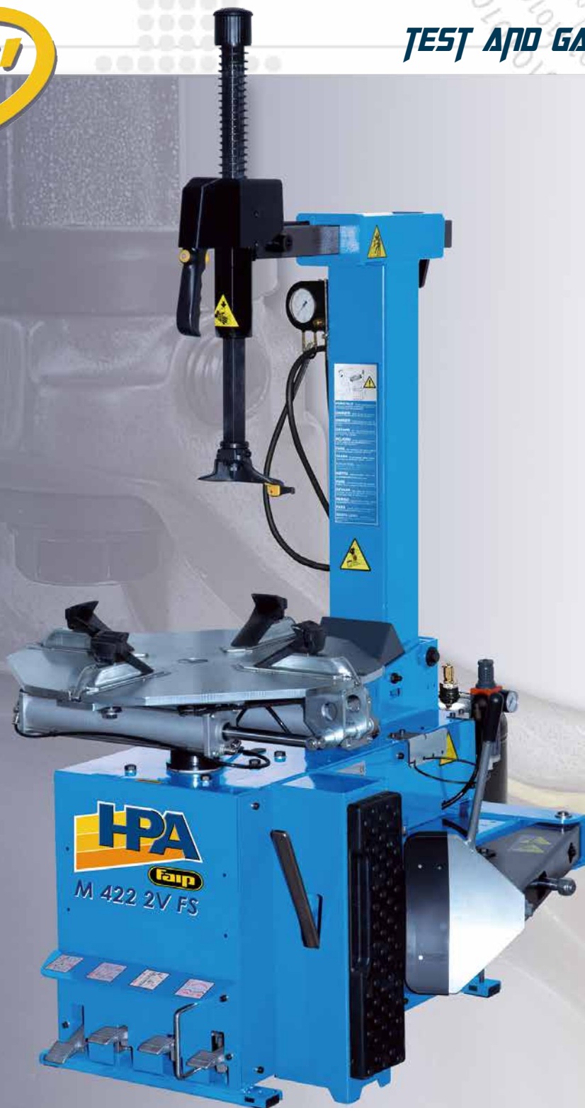
M 422 2V FS