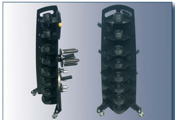
Ref. 8-21100244 - HIGH PRECISION COLLETS (HPC)